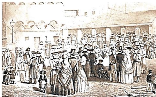
Krigsfångar och borgare från staden Lewes, sydväst om London, umgås på fängelsets gård.