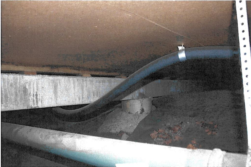
Modulerna sitter på betongbjälklag/plintfundament. Dimensioner ca 400x400mm diameter, 4 rader med CC ca 4,8m