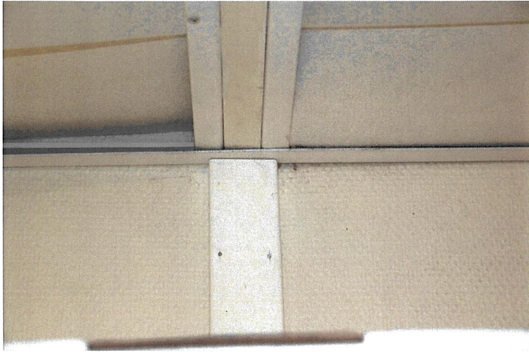
Skarv vid övergång mellan yttervägg och takbjälklag