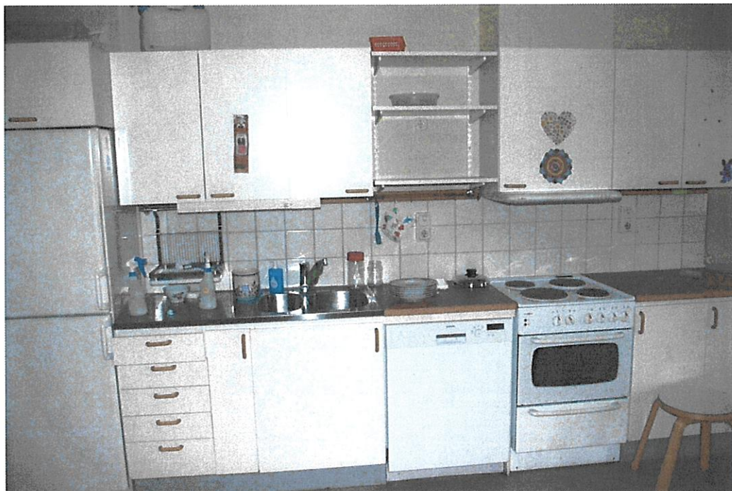
Köksvrån i medelstora rummet (mellan de 2 större klassrum)