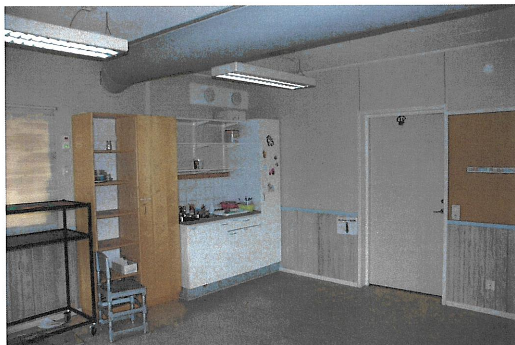
Möbler och annan indredning (delvis whiteboard, etc) medföljer.