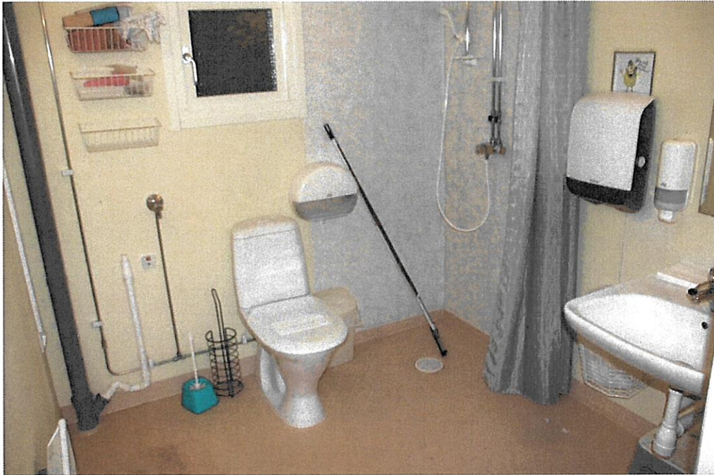
Handikapanpassad toalett med duschhorn. Dörren också handikapanpassad. Lägre rumshöjd likarant som i hallen.