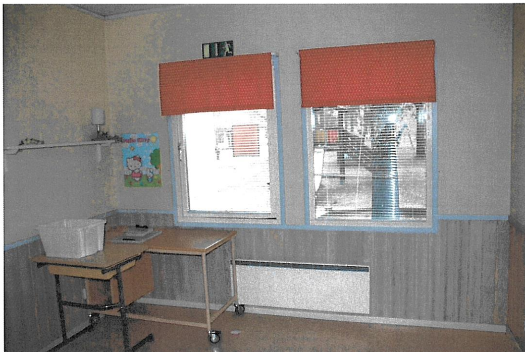
Mindre grupprum med full rumshöjd (2,70m)