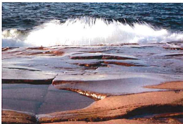
Näringslivsnämnden, Kumlinge kommun, 9/2021

På våren 2022 ska arbetet ha gett resultat: Ett team av aktörer som kan varandras utbud och vill lyfta det, en modernare marknadsföring och en gemensam bildbank samt förhoppningsvis en hel del besökare på kommande under en längre säsong!