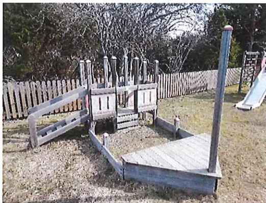
KLÄTTERSTÄLLNING A (skepp)

Bilderna nedan hör till annonsen om klätterställningar till salu på spalten bredvid.