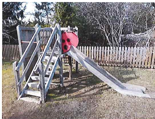
KLÄTTERSTÄLLNING B (rutschkana)

För bättre bildkvalité än i papperstidningen kan du söka upp tidningen på kommunens hemsida www.kumlinge.ax , där finns bilder i färg.