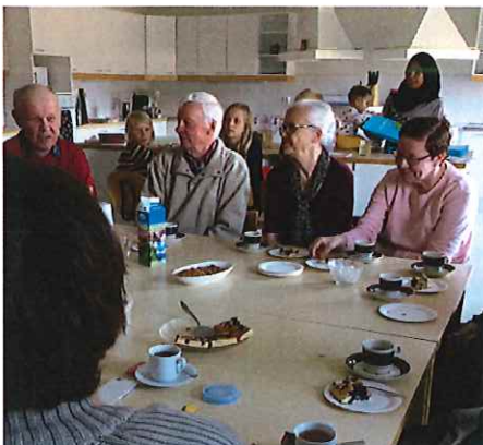
Nya bekantskaper över en kopp kaffe.