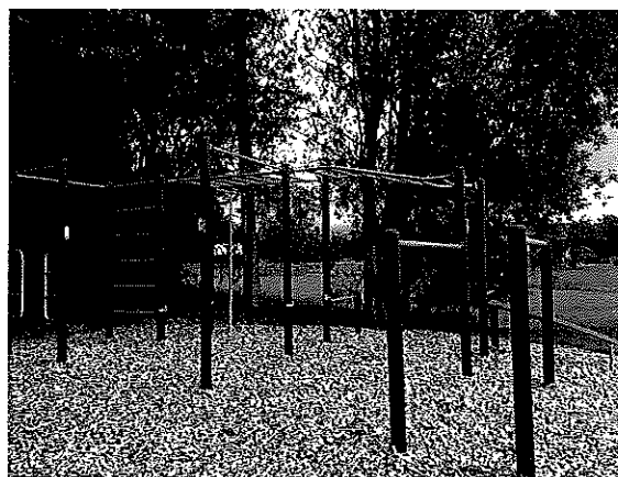
Bild från utegymmet vid skolan.

Vi tackar alla som deltagit i årets simskolor. På Enklinge simskola deltog 7 barn, Kumlinge simskola deltog 11 st och Seglinge simskola deltog 4 st. Hop-pas vi ses nästa sommar igen.